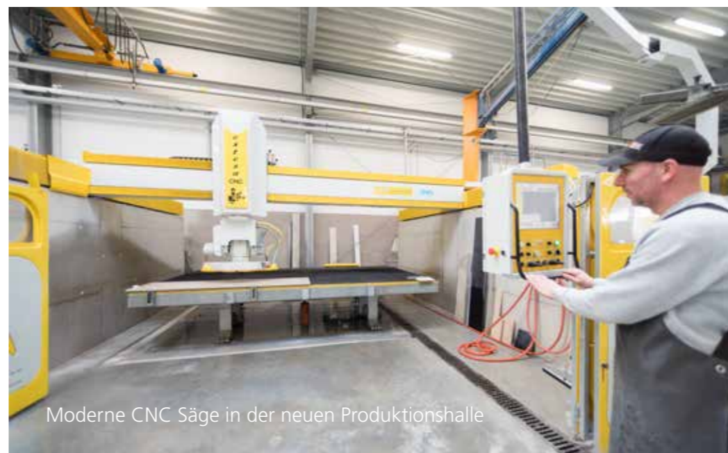
Moderne CNC Säge in der neuen Produktionshalle

Fertigung der Küchenarbeitsplatten, Waschtische, Treppenanlagen, Fensterbänke, Boden- und Wandverkleidungen sowie sonstigen Zuschnitten. Anschließend werden die gesägten Teile am Kantenautomaten, am Bearbeitungszentrum oder manuell weiterveredelt. Das Rohplattenlager befindet sich noch zum großen Teil im Außenbereich auf dem 5.800 qm großen Betriebsgrundstück. Langfristiges Ziel ist es, eine Rohplattenhalle im Anschluss an die Produktion zu errichten, wobei es Lars Jauer wichtig ist, immer den Überblick über die Investitionen zu behalten. 26 Jahre habe man erfolgreich auch aus dem Bürocontainer seine Kunden zufrieden stellen können, blickt er auf seine alte Wirkungsstätte auf dem Betriebsgrundstück zurück, die jetzt mit der alten Produktion an einen befreundeten Grabsteinmetz verpachtet wurde.