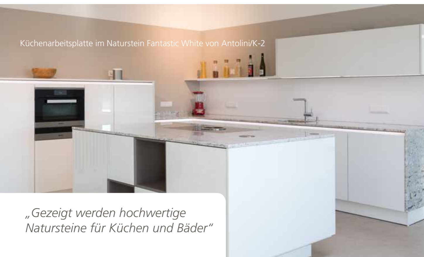
Küchenarbeitsplatte im Naturstein Fantastic White von Antolini/K-2

„Gezeigt werden hochwertige Natursteine für Küchen und Bäder“