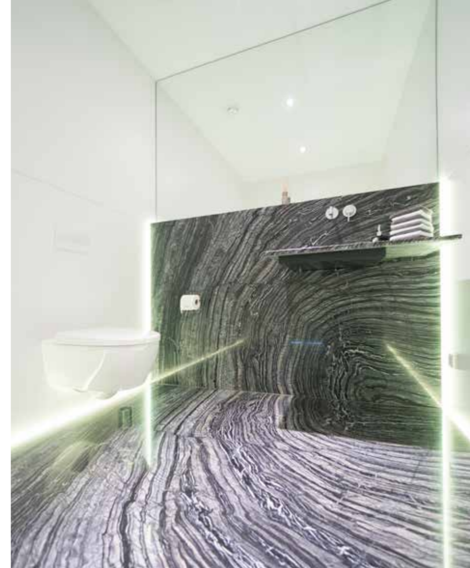
Herren Gäste WC aus dem Marmor Silver Brown Wave

Unsere Öffnungszeiten Mo - Fr 08.00 - 12.00 Uhr Mo - Do 13.00 - 17.00 Uhr Fr. 08.00 - 14.30 Uhr Sa. 09.00 - 12.00 Uhr