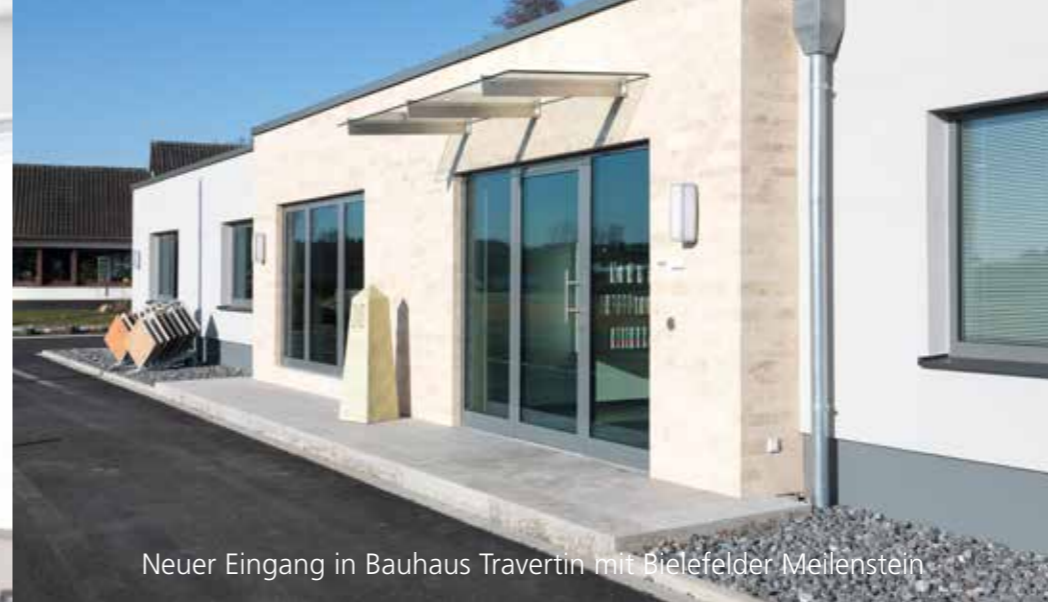
Neuer Eingang in Bauhaus Travertin mit Bielefelder Meilenstein