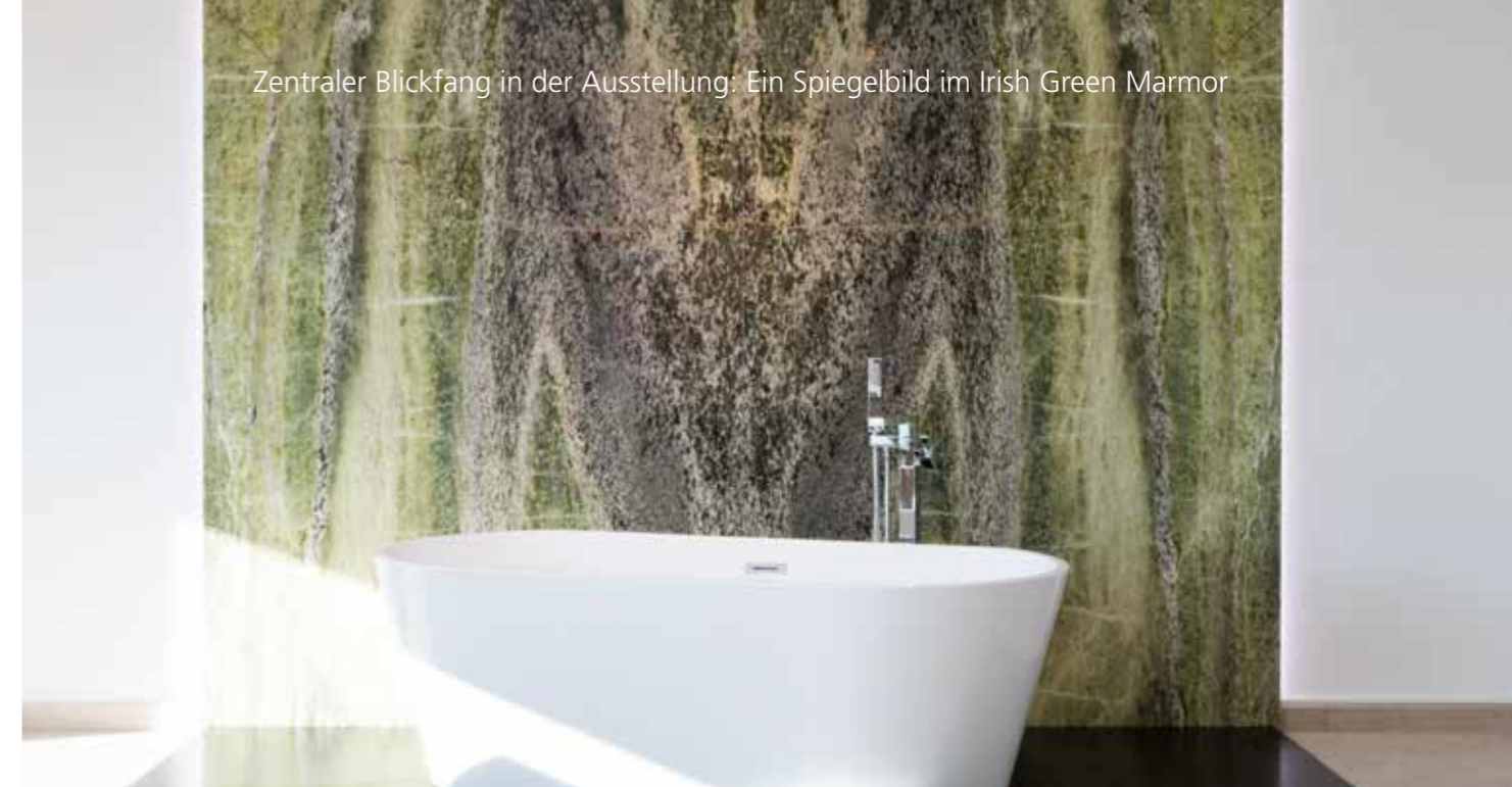
Zentraler Blickfang in der Ausstellung: Ein Spiegelbild im Irish Green Marmor

Schwerpunkt der Ausstellung ist die Beratung von Küchen und Bädern. Mit der Produktion von über 300 Küchenarbeitsplatten im Jahr hat Jauer ein gutes Preis-/Leistungsverhältnis für seine Küchenpartner entwickelt. Viele Kunden werden von den umliegenden Küchenstudios zur Auswahl der Küchenarbeitsplatte in die Manufaktur geschickt. Hier geht es in erster Linie um die Wahl der Naturstein-, Keramik- oder Quarzwerkstoffarbeitsplatte mit der gewünschten Oberfläche.